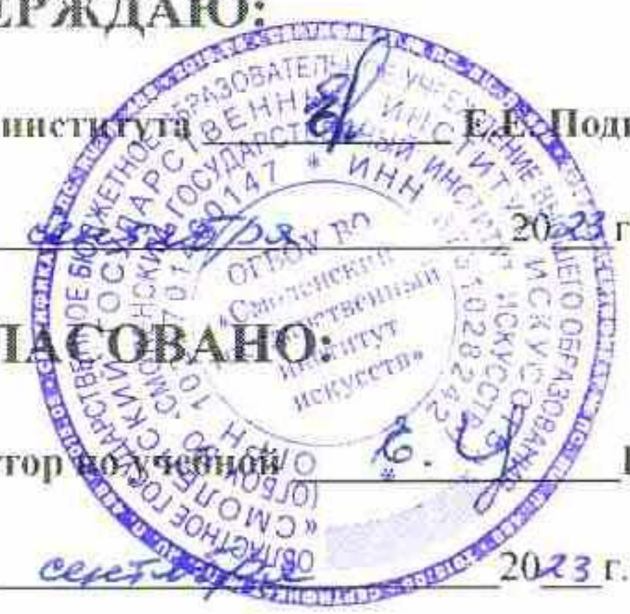
ГРАФИК КОНСУЛЬТАЦИЙ ОБУЧАЮЩИХСЯ

Специальность: 51.02.03 Библиотековедение